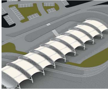
Kurze Umsteigewege bei Don Bosco

Rund neun Millionen Euro werden in den Nahverkehrsknoten Don Bosco investiert, der Bahnstation und vier Busse verbindet.