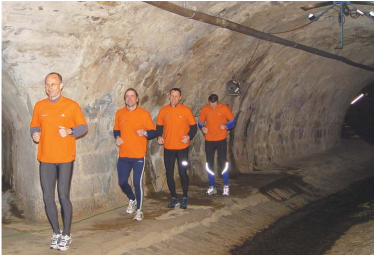
Laufend „abtauchen“ ins Grazer Kanalsystem kann man am 22. März

Lust auf ein außergewöhnliches Lauf-Erlebnis? Am 22. März, dem „Weltwassertag“, lädt das Kanalbauamt zum unterirdischen Lauf ein!