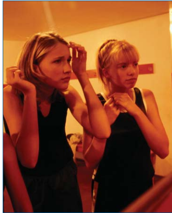
Das Steiermärkische Jugendschutzgesetz soll zukünftig stärker kontrolliert werden

S icherheit ist ein wertvolles Gut und trägt maßgeblich zur Steigerung der Lebensqualität in einer Stadt bei. Tagtäglich verunsichern uns Medienberichte von Einbrüchen, Diebstählen und Gewaltakten – dagegen muss etwas unternommen werden, sind sich Politik und Exekutive in Graz einig.