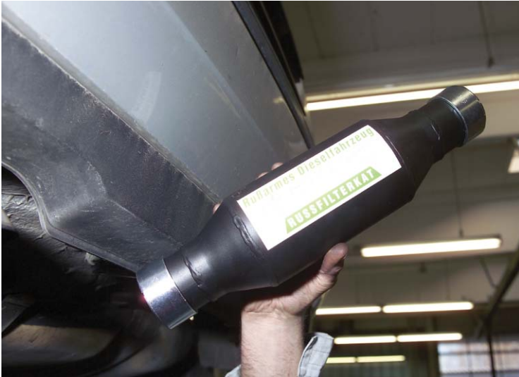
Mit diesem Partikelfilter werden gefährliche Kleinstteilchen aus der Luft verbannt.