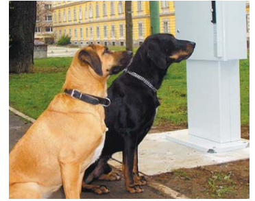
„Gassi-Automaten“ für ein sauberes Graz

und nach der Notdurft des Hundes muss ein „Hu-Ko-Sa“ – ein Hunde-Kot-Sackerl – her. Für Tier- und Kinderfreunde eine Ehrensache, oder? In Graz stehen derzeit 49 Automaten zur Verfügung. Sie wissen nicht, wo Sie das nächste „Hu-Ko-Sa“ bekommen? Eine komplette Liste der „Gassi-Automaten“ finden Sie unter www.graz.at bzw. in untenstehendem Info-Kasten. ■